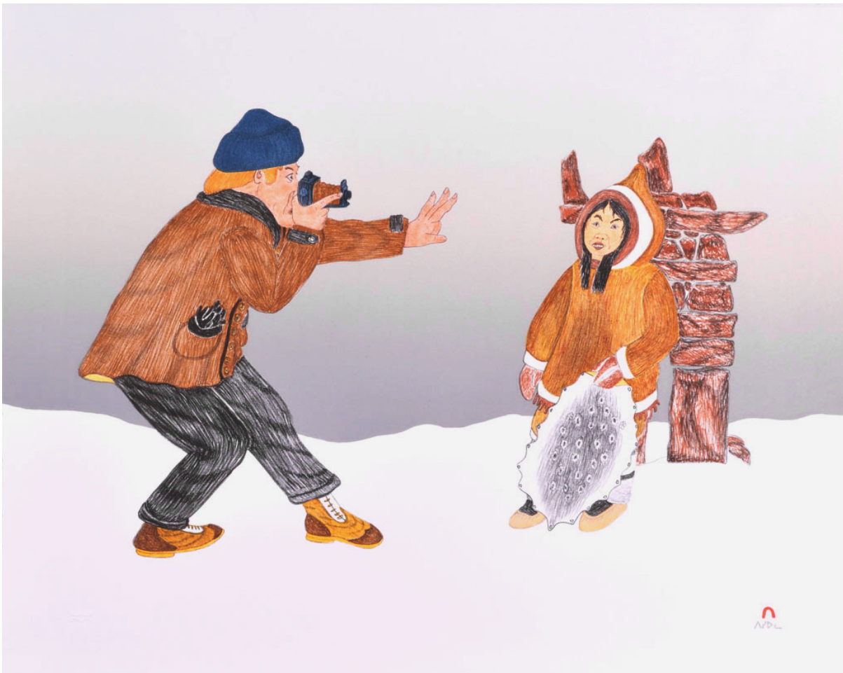
Abb.1: Kananginak Pootoogook: The First Tourist. Lithographie auf Velinpapier, 57 x 71 cm. Cape Dorset 1992.

Die Arbeiten des aus Kanada stammenden Inuk-Bildhauers und Malers Kananginak Pootoogook sind durch einen ausgeprägten grafischen Stil sowie seine einzigartige Perspektive auf die Arktis und die Lebensweise von Inuit-Gemeinschaften gekennzeichnet. Durch seine einfühlsamen und humorvollen Darstellungen des Inuit-Lebens und seiner Umgebung ermöglicht Pootoogook einen Einblick in eine Lebenswelt, die vielen außerhalb der Arktis fremd ist, siehe Abb. 1. 3 So trägt der Künstler zur Wertschätzung und zum Verständnis der Inuit-Kultur bei. Zudem stellte er als erster Inuk-Künstler 2017 auf der Venedig Biennale aus. 4 Pootoogooks Position erschien uns bei der Konzeption der Vermittlungseinheit als besonders passend, da seine Darstellungen vorwiegend Lebensräume bzw. -welten abbilden, in denen die Folgen des Klimawandels bereits jetzt deutlich sichtbar sind.