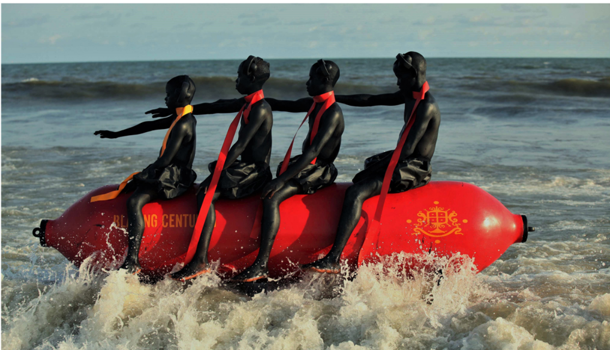
Abb. 2: Wilfred Ukpong: Strongly, We Believe In the Power of this Motile Thing That Will Take Us There. #2 aus der Serie: Blazing Century 1: Niger-Delta/Future-Cosmos . Gemischtes Medium, Pigmentdruck und Acryl auf Leinwand im Künstlerrahmen, 150 x 140 x 0,5 cm. o.J. © Wilfred Ukpong. Quelle: https://lenscratch.com/2022/05/wilfred-ukpong/ (23.05.24)

Themen auseinander, beispielsweise im Nigerdelta, wo er in enger Abstimmung mit den dort lebenden Communities performative, filmische und installative Kunstwerke kreiert. 5 Im Zentrum seines Schaffens steht das Blazing Century Projekt , siehe Abb. 2: Ein alternatives Universum, das die Machenschaften der Ölindustrie und ihre Verwüstungen der Landschaft anprangert und den ausgebeuteten Bewohner*innen des südlichen Nigeria eine Stimme und eine performative Plattform bietet. 6